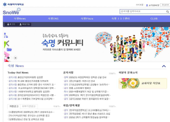
SnoWe(커뮤니티) 각종 공지사항을 확인할 수 있는 곳