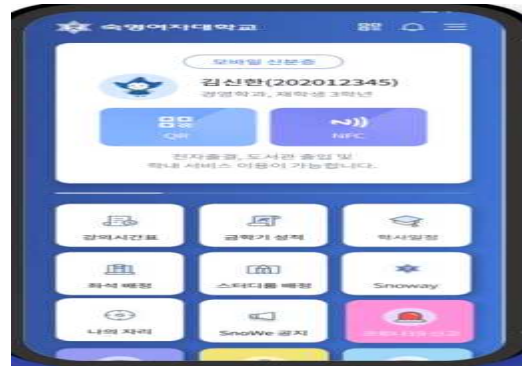
헤이영(APP) 숙명 모바일 서비스 종합 어플리케이션