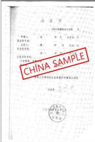
<중국 친족관계증명서 공증본>

출생증명서 또는 가족관계증명서(영어나 한국어가 아닌 경우 번역문 필요) Birth certificate