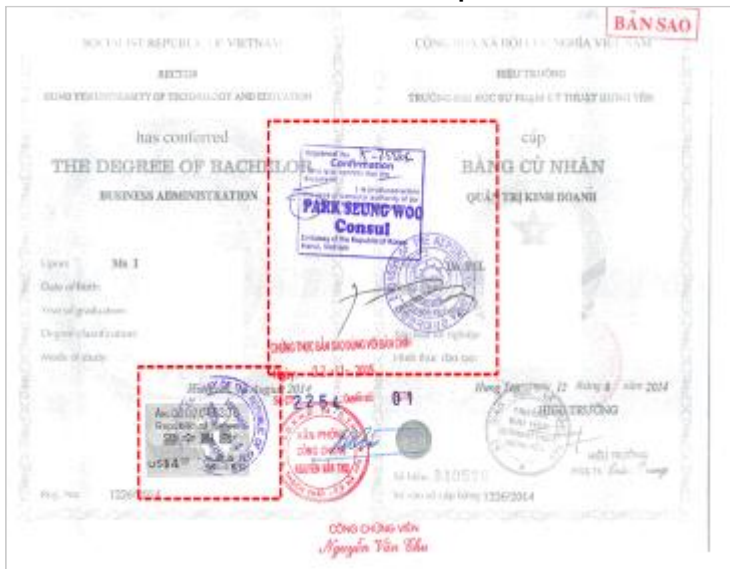
<베트남 학위증서 대사관인증>

대사관 학위증명서 인증서 Verification of diploma from Korean Embassy