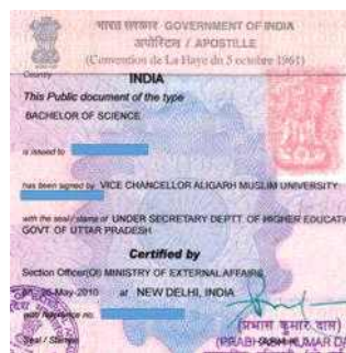
<인도 아포스티유 서식>