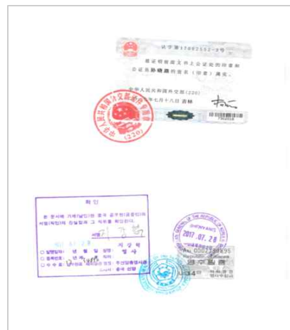
<중국 학위증서 공증본 대사관인증>