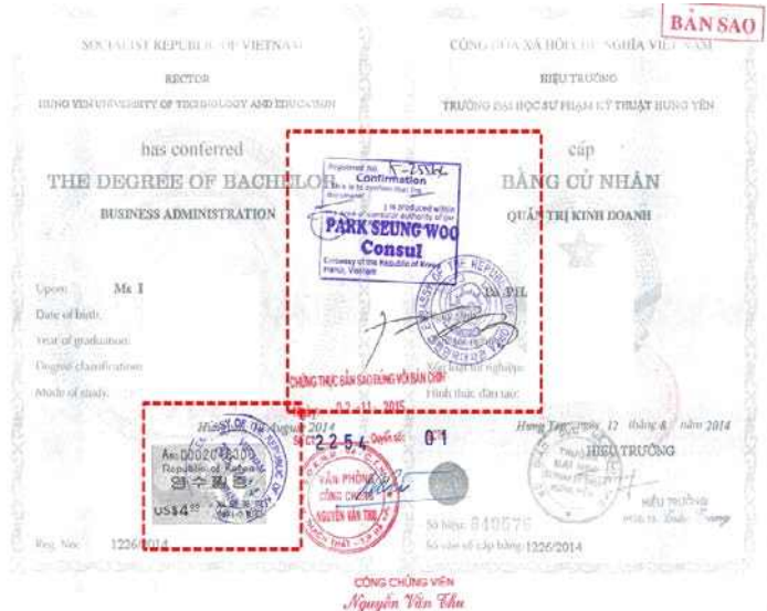
<越南学位证书大使馆认证>