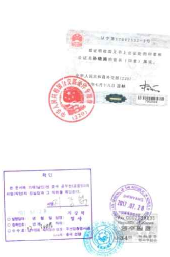
<中国学位证公证件大使馆认证>