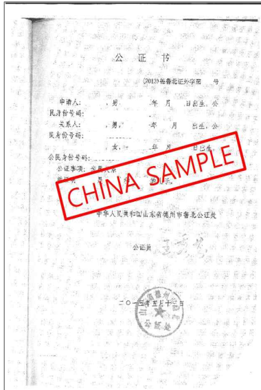
<中国家族关系证明公证本>